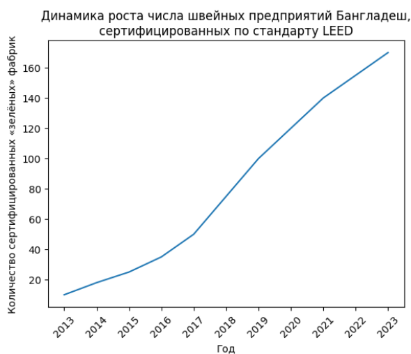
Рис. 2. Динамика роста числа швейных предприятий в Бангладеш, сертифицированных по стандарту LEED

Инновационная экосистема текстильной промышленности России характеризуется институциональной координацией. Согласно данным Минпромторга России [8], развитие отрасли опирается на кластерные программы: распространение технологий осуществляется через инновационные центры и кластеры. Российская модель выстроена в соответствии с внутренними промышленными приоритетами.