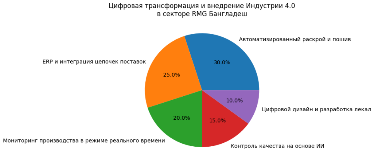
Рис. 1. Внедрение цифровой трансформации и технологий Индустрии 4.0 в швейной промышленности Бангладеш

решения повышают стабильность качества продукции в условиях глобальных цепочек поставок.